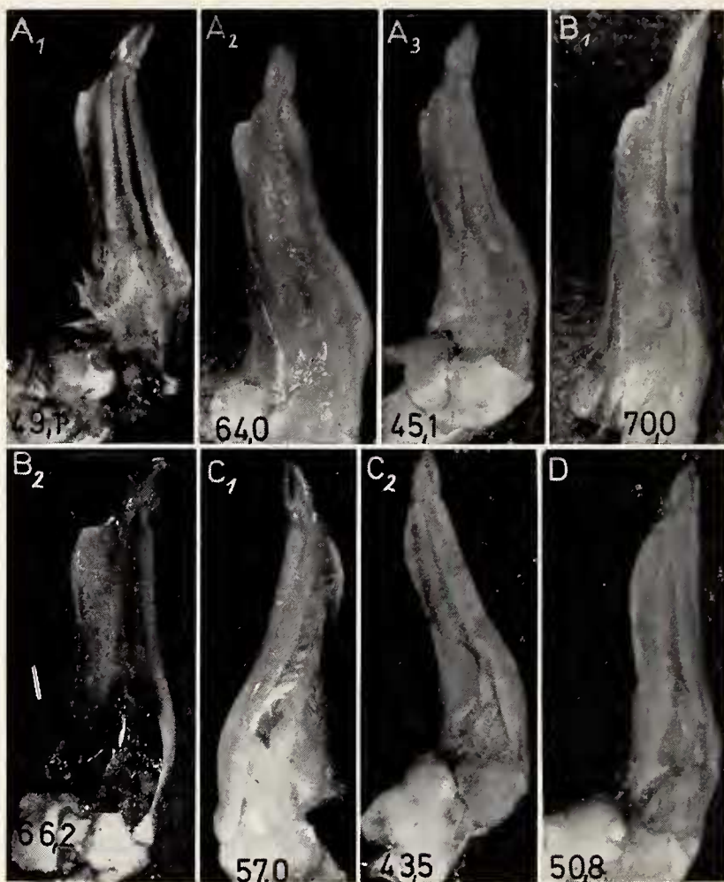
Abb. 2. Die ersten Gonopoden aus den drei Hauptflußsystemen Afghanistans nach dem Einwanderungsweg geordnet. A 1 Peshawar (Pakistan), A 2 Khabul-Fluß, A 3 Pech-Fluß (Indus-System), B 1 Arghandab, B 2 Kash Rud (Helmand-System), C 1 Murghab, C 2 Mazar-e-Sharif (Amu Dario-System), D Khulm-Fluß (Amu Dario-System). Die Ziffern am unteren Bildrand geben die Carapax-Breite in mm an.

2500 m vor. Nach Ufergestaltung, Sauerstoffgehalt des Wassers und Verhalten der Krabben im Wohngebiet wurden 4 Hauptbiotope unterschieden.